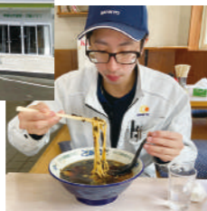
ランチはラーメン