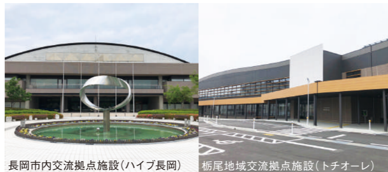
長岡市内交流拠点施設(ハイブ長岡) 栃尾地域交流拠点施設(トチオーレ)

三協設備工業では、空調衛生設備というインフラを支える地域密着事業を展開しています。特に長岡市を中心とした中越エリアでの仕事が多く、長岡の現場で働くことも多くあります。地域を支えている実感が“いい仕事”の実現につながっています。