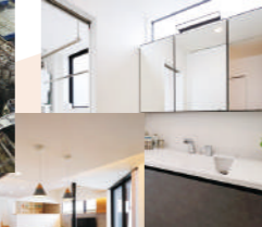
自宅の施工も行いました